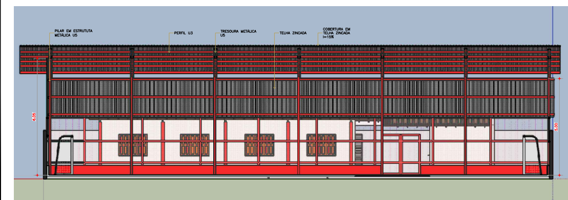
3 CORTE BB ESCALA 1:75